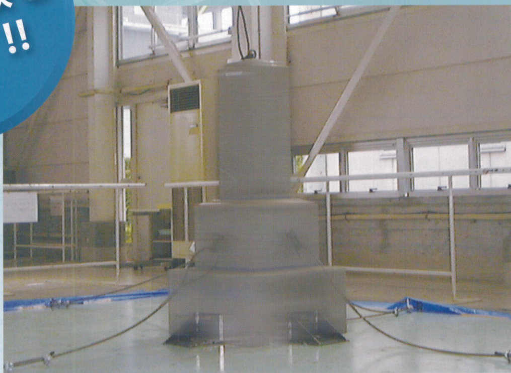
実験場所 独立行政法人都市再生機構都市住宅技術研究所